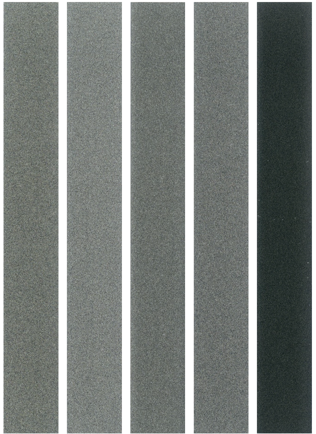
Antica GG Base solvente 13800002 Antica GG Base acqua 13810002 Antica GM Base solvente 13820003 Antica GM Base acqua 13830003 Antica GF Grafite 13800001