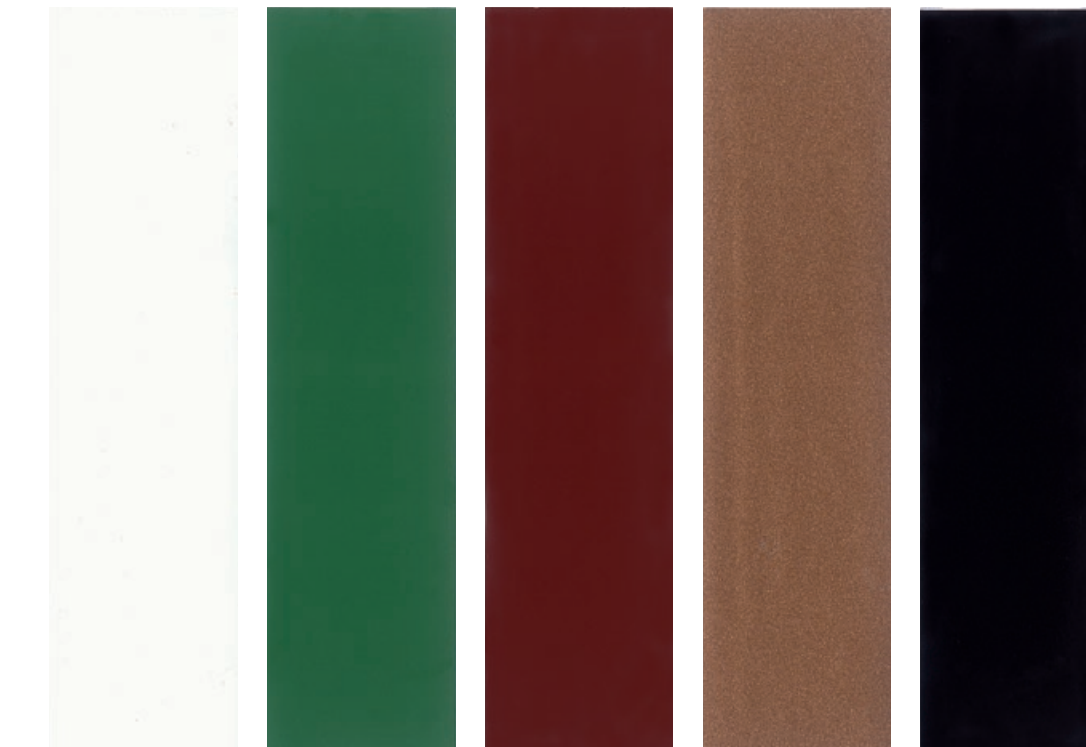
Bianco 0050 Verde 0190 Rosso ossido 0650 Rame 0600 Testa di moro 0627