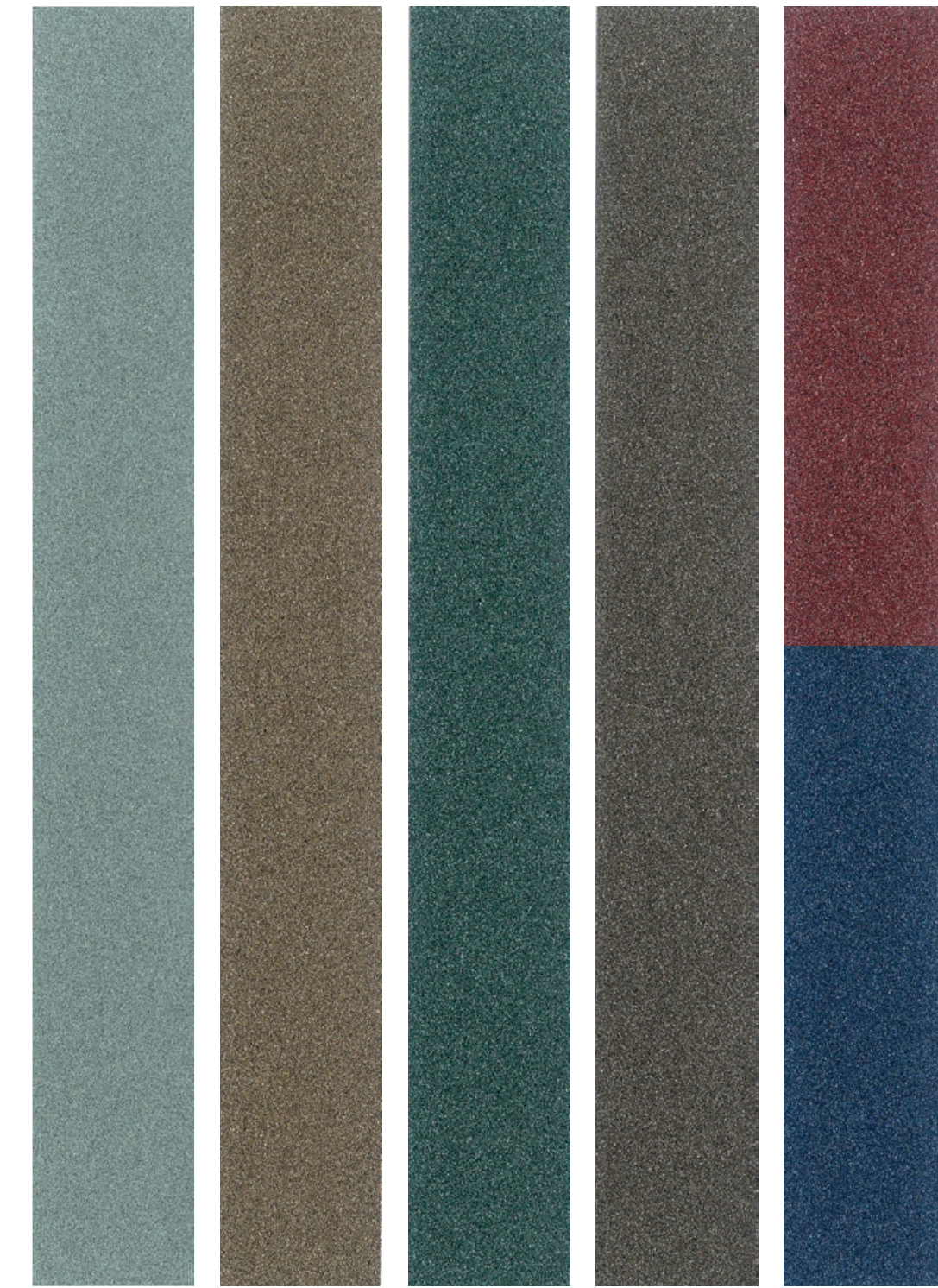
Grigio ferro 0429 Ramato 0416 Verde 0435 Bronzo 0436 Colormaker Rosso 0418